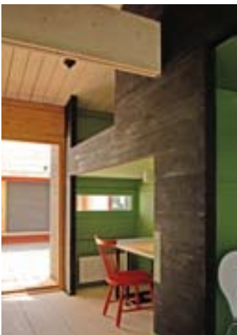
Bäddarna har flyttats uppåt och liknar koder: Under dem finns utrymme för arbets- eller lekplats.