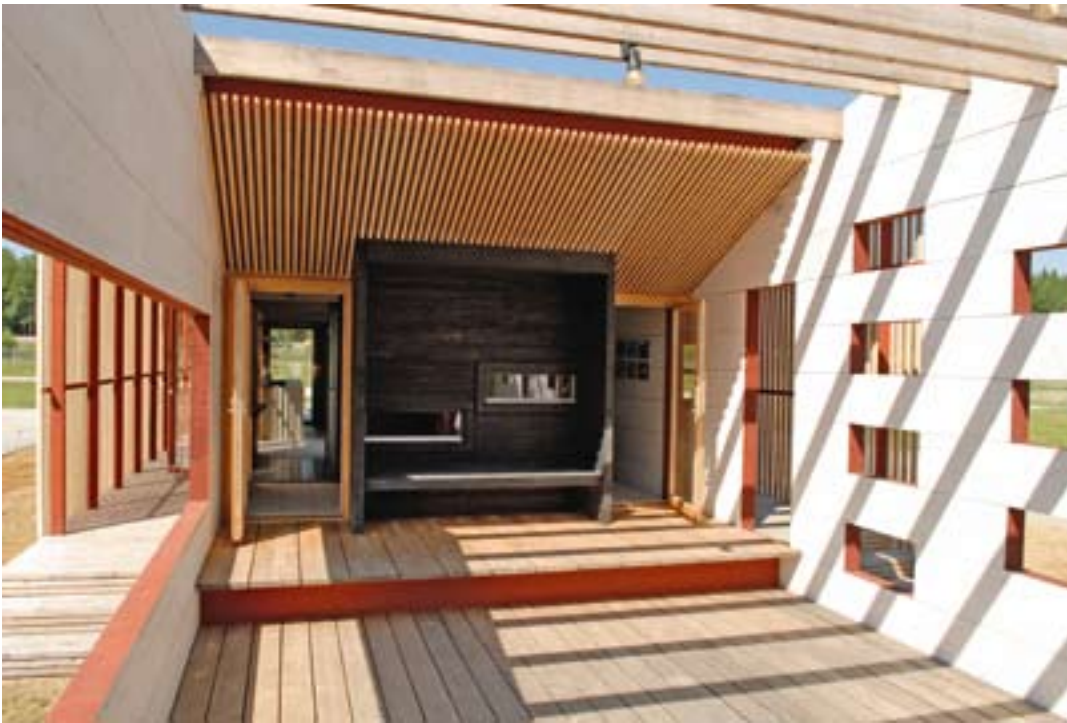
Altanendäcket med pergola är placerad mellan bostadsdelen och förrådet.